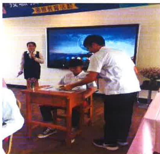
說明：點菜與餐服實務示範