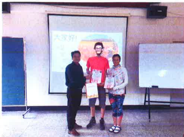
部主任頒發感謝函