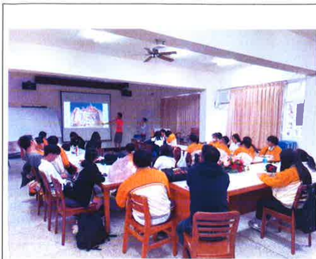
環遊世界心得分享