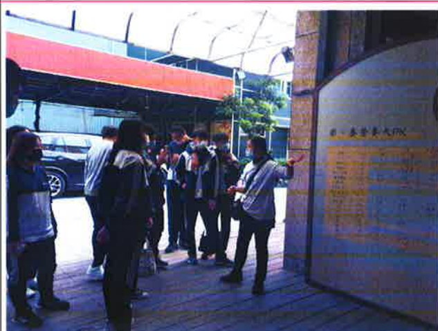
說明：大型食品烘培廠介紹