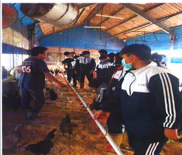
說明：牧場實務介紹