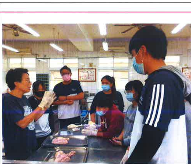
說明：外科縫合示範實作