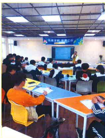
日本動漫文化說明