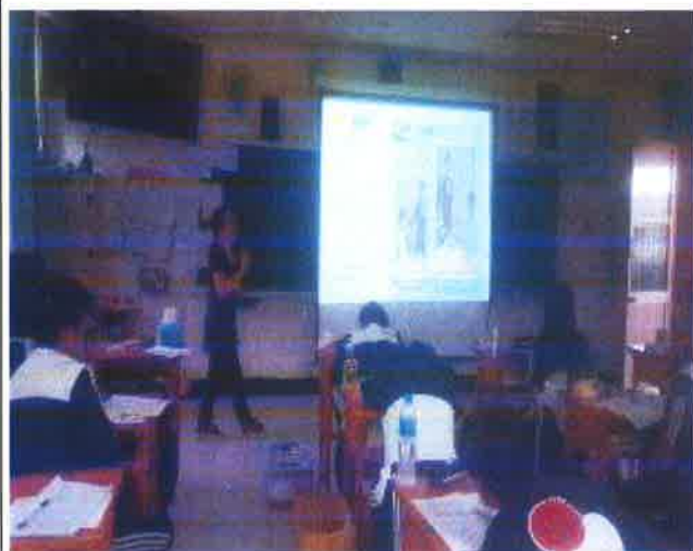
說明:餐飲服務禮儀介紹