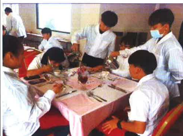
說明：點菜與餐服實務