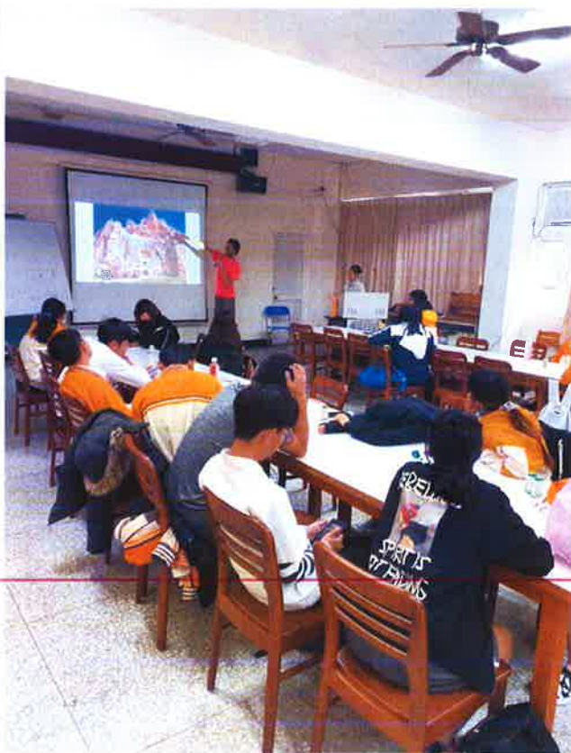
環遊世界心得分享