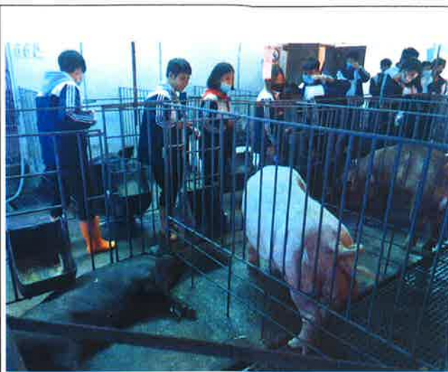
說明：公豬人工採精實作