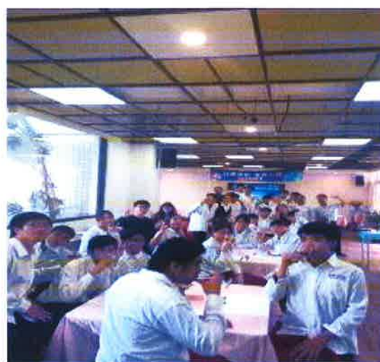
說明：美好的英語體驗活動~大合照