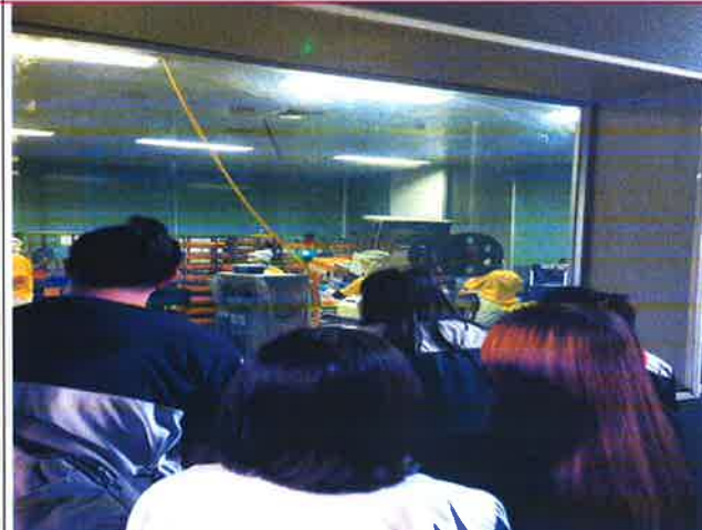
說明：烘培流程參觀