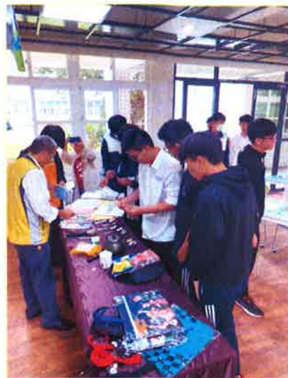
日本職人手作品展示