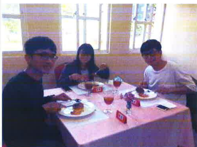
說明：邀請師長參與體驗