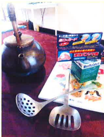
日本生活小物展示