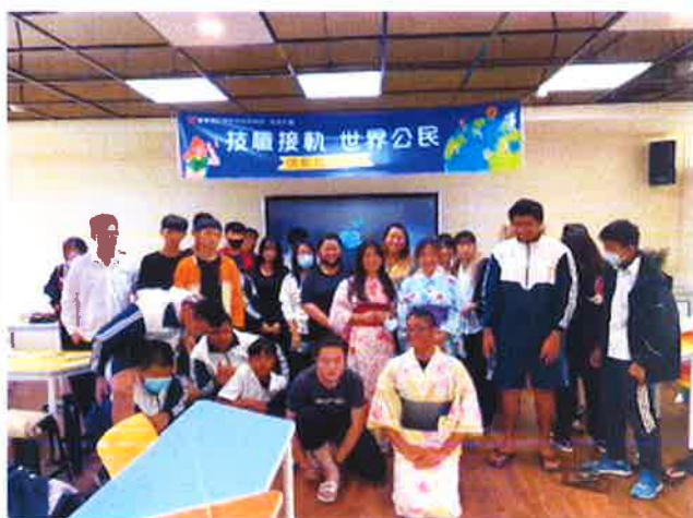
日本浴衣文化合照