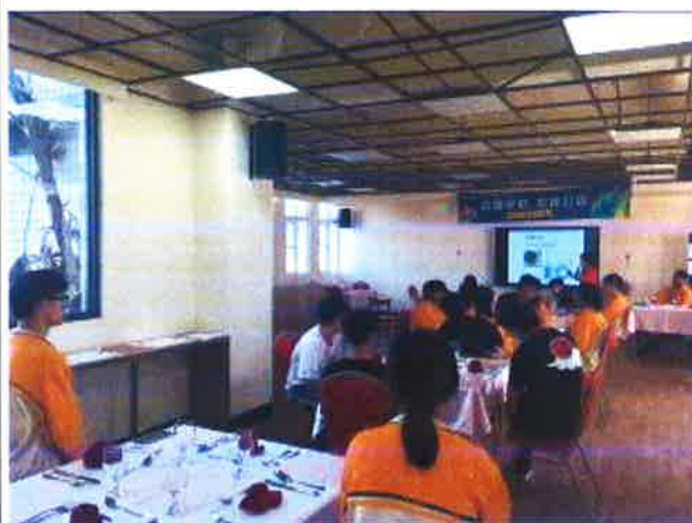
說明:高三同學西餐禮儀講解