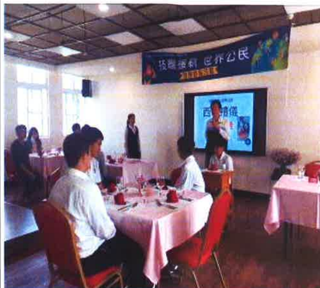
說明：體驗活動~校長開場致詞