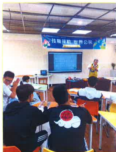
日本職人創作文化說明