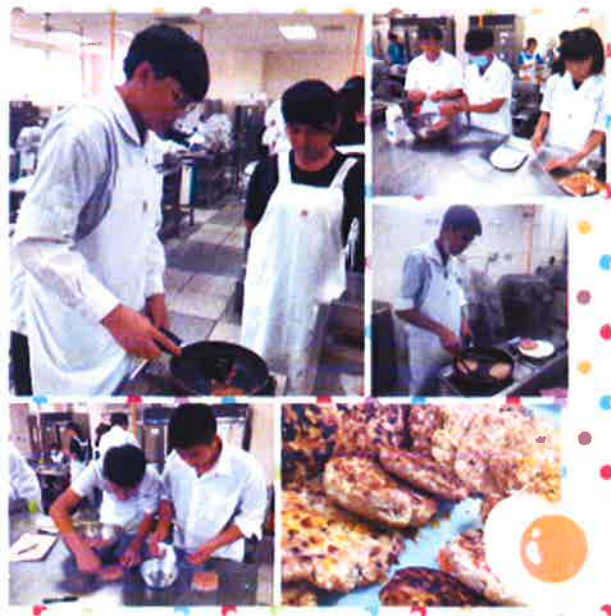
說明：西式漢堡排製作