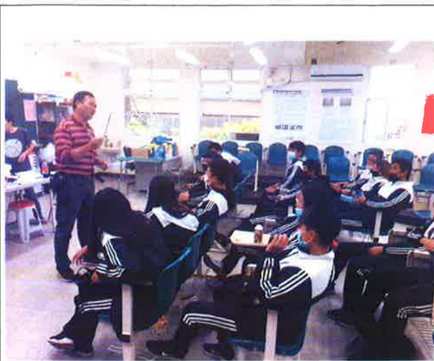
說明：公豬人工採精介紹