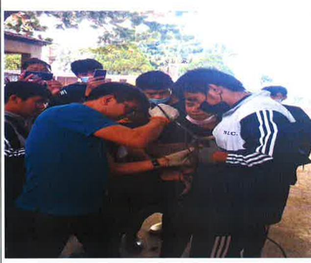
說明：羊隻去角實作