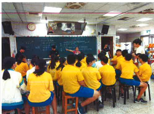
科主任介紹家政科