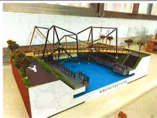
圖 2.學生利用雷射雕刻機製作的創意木橋競賽的模型。