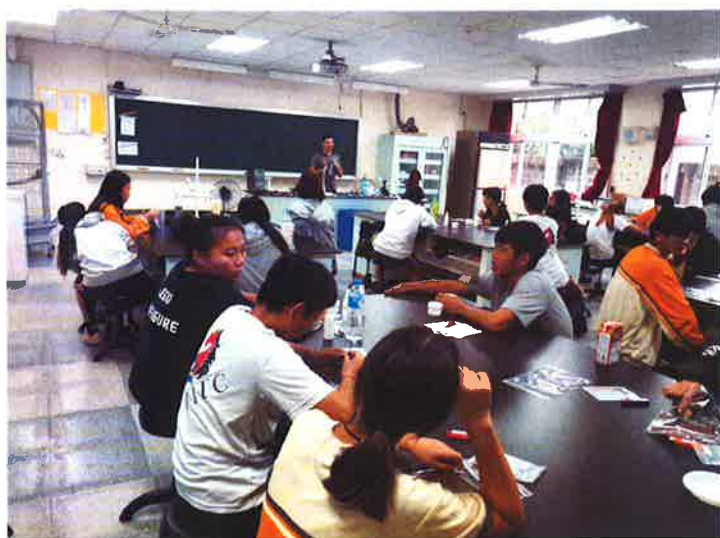
說明：皮革原料認識