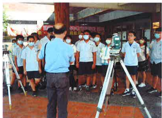
地點：建築館 照片敘述：測量體驗