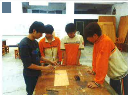
圖 3.學生利用放學製作創意木橋競賽模型。