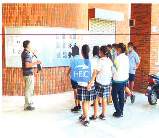
介紹汽車工廠環境