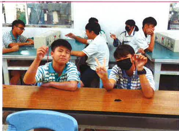
學生作品完成後合照