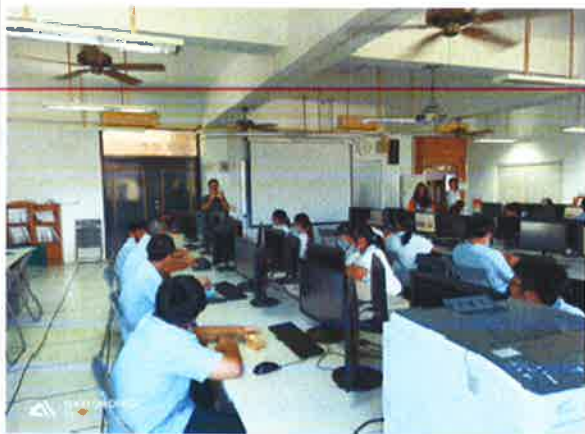
說明：講解科務及研習內容