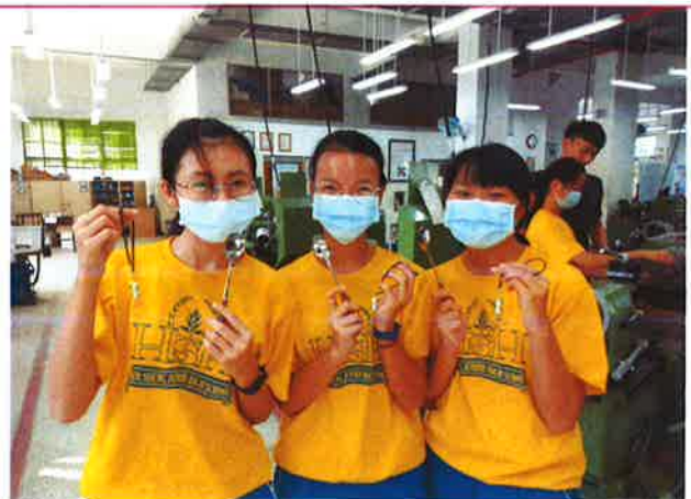
學生作品完成後合照