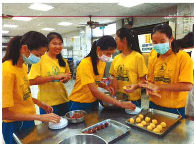
進行外皮及內餡量秤