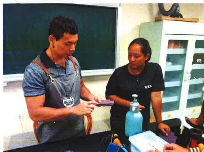
說明：皮製小品製作細部說明