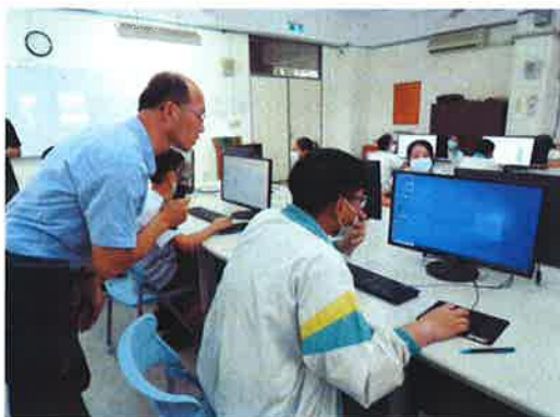
地點：建築館 照片敘述：電腦繪圖體驗