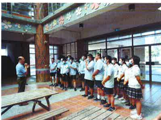
地點：建築館 照片敘述：科館導覽