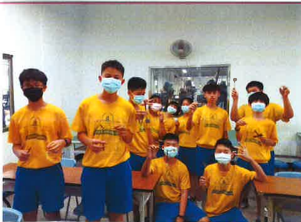
學生作品完成後合照