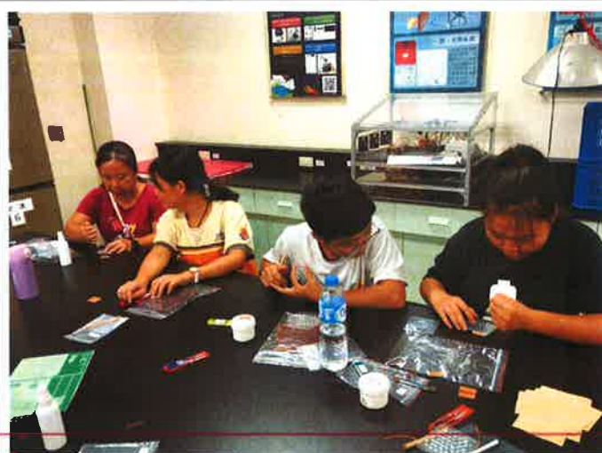
說明：皮製小品製作