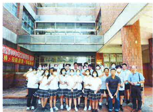
地點：建築館 照片敘述：大合照