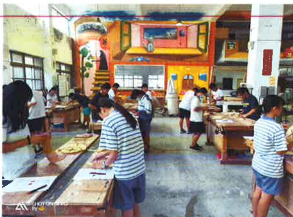
說明：邊講解科務及研習內容