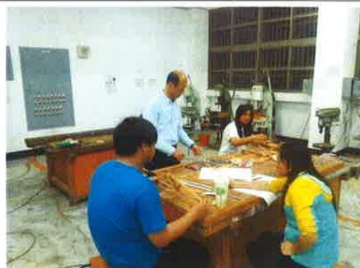
圖 4.學生利用放學製作創意木橋競賽模型。