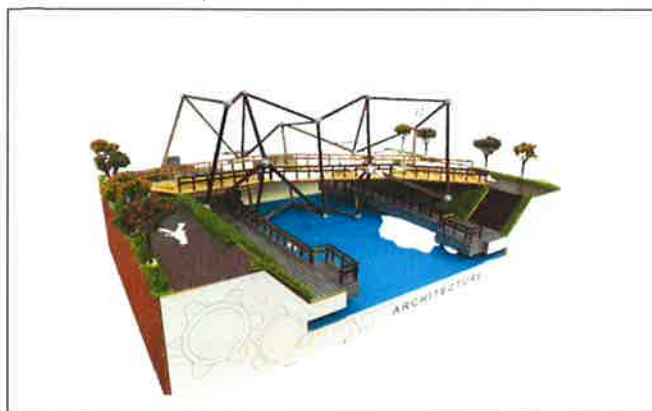
圖 1.學生利用雷射雕刻機製作的創意木橋競賽的模型。