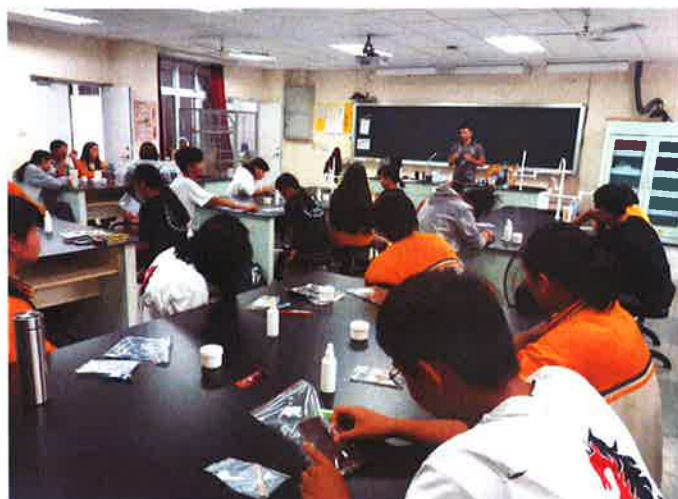
說明：皮製小物材料及作法介紹