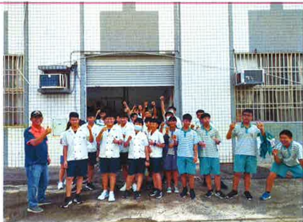
學生作品完成後合照