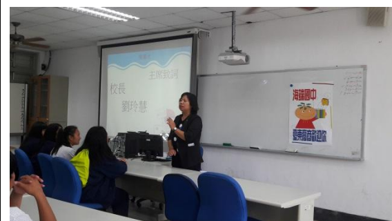
活動說明：2016. 11. 2 海端國中學生