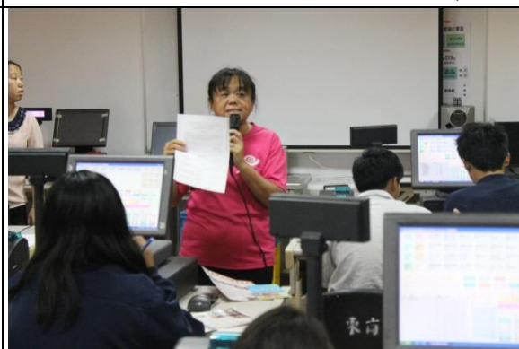
活動說明：2016. 11. 2 海端國中學生