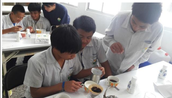
活動說明：2016. 11. 2 海端國中學生