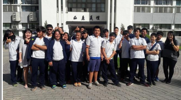
活動說明：2016. 11. 2 海端國中學生