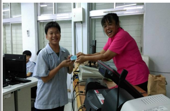
活動說明：2016. 9. 29 新生國中學生