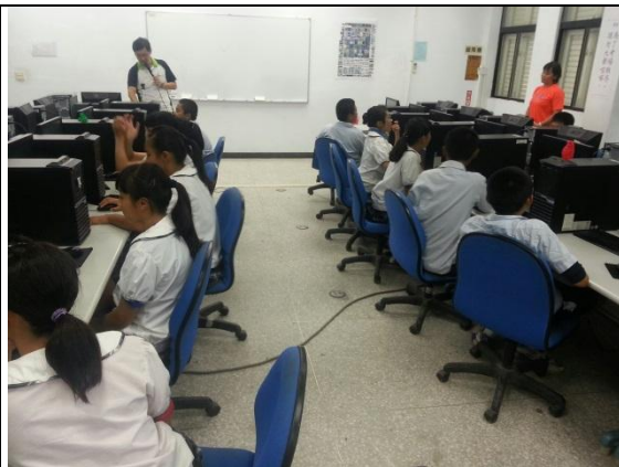
活動說明：2016. 9. 29 新生國中學生