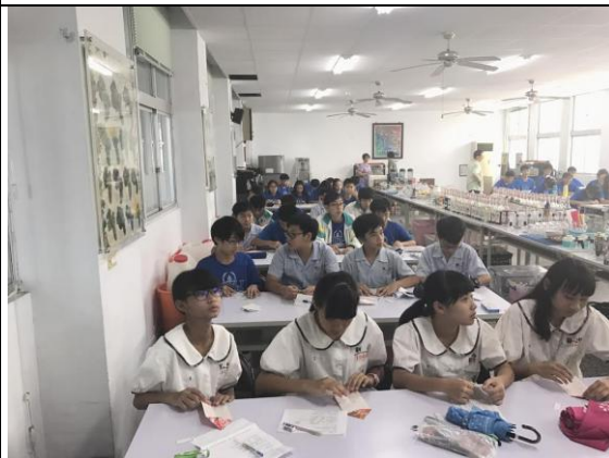
活動說明：2016. 9. 29 新生國中學生