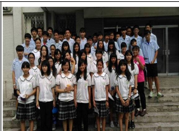
活動說明：2016. 9. 29 新生國中學生